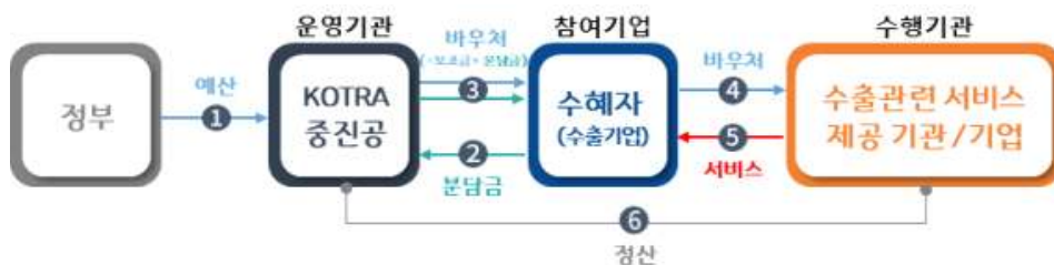
[ 수출바우처 발급·정산 흐름도 ]

매칭펀드로 조성한 사업비(①국고+②기업분담금)를 재원으로 수혜기업(참여기업)에 ③바우처(가상쿠폰)를 발급하고, 수혜기업은 수행기관 서비스를 ④⑤이용한 후 ⑥비용 정산